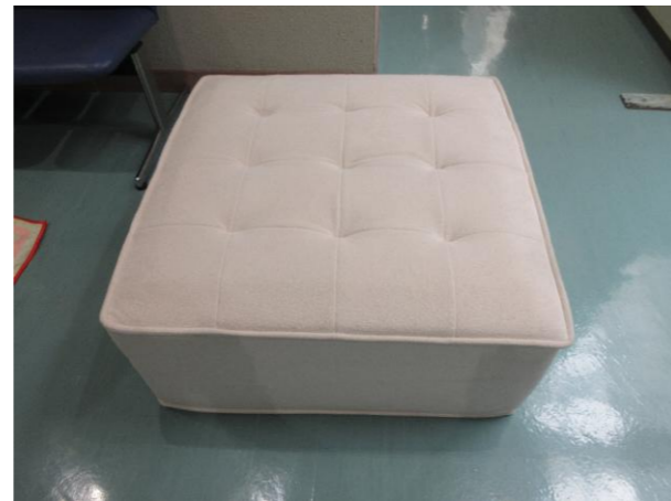
② クッションソファ 落札額 2,300円/応札 2件