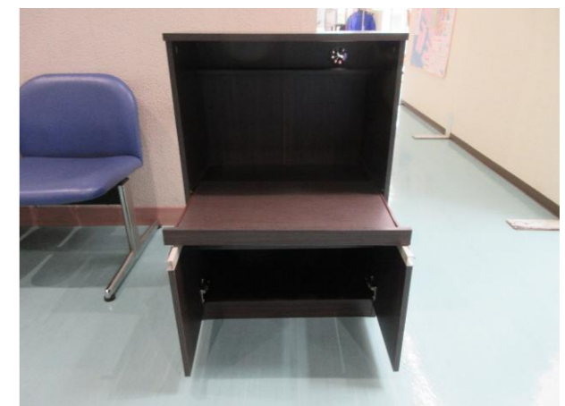
④ レンジ台 落札額 1,100円/応札 2件