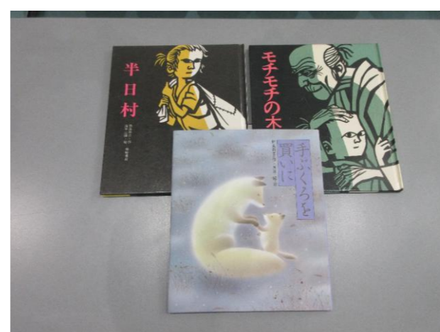
⑪ 児童書(3冊) 落札額 110円/応札 1件