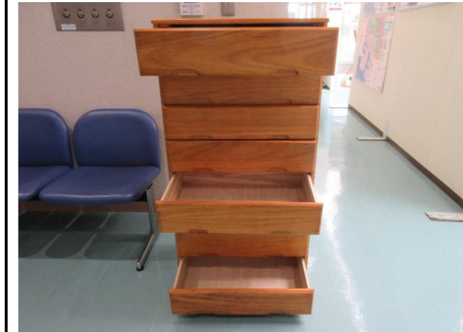
⑫ 7段ハイチェスト 落札額 4,000円/応札 6件