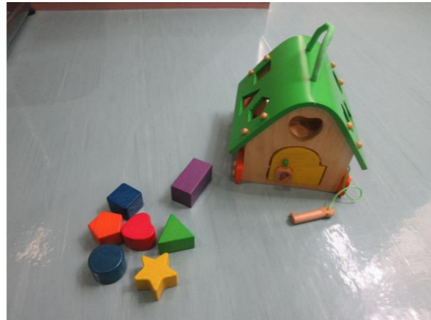
⑥ 型はめパズル 落札額 500円/応札 1件