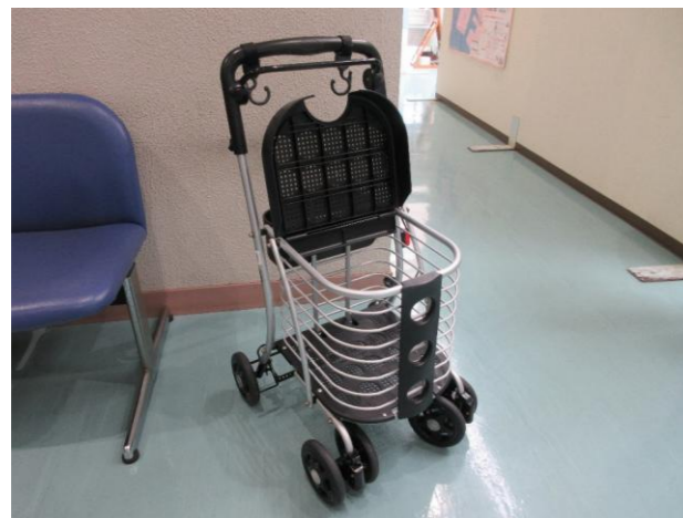
⑨ シルバーカー 落札額 100円/応札 1件