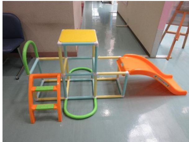
① 滑り台付きジャングルジム 落札額 2,000円/応札 5件