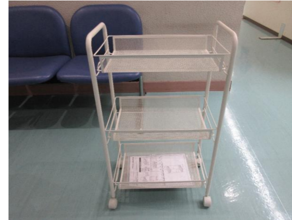
⑦ キッチンワゴン 落札額 1,200円/応札 5件