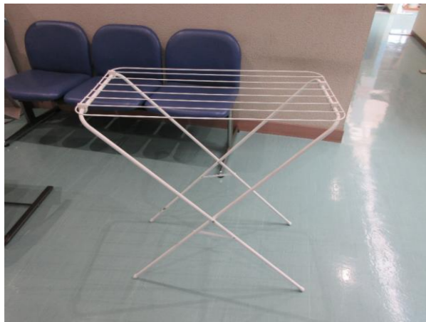
⑤ 物干しラック 落札額 450円/応札 6件