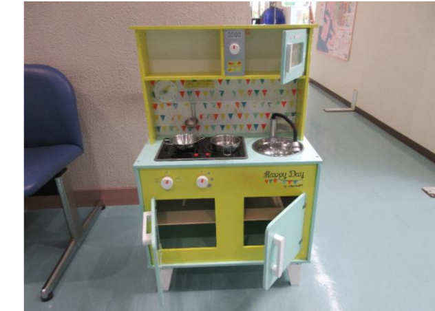
⑧ 木製おままごとキッチン 落札額 3,500円/応札 12件