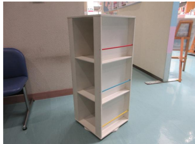
⑩ 回転式本棚 落札額 3,160円/応札 8件